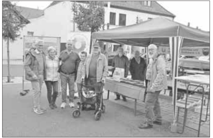
Am Info- und Verkaufsstand des Gartenbauvereins freute man sich über den guten Zuspruch.