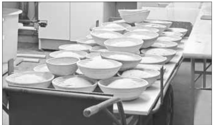
Die Qualität der im Steinbackofen gebackenen Brotlaibe hängt neben den guten Zutaten von den ausreichend langen Gärzeiten für den Teig ab.